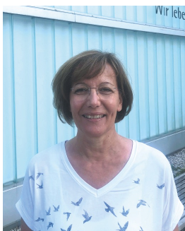
Anne Klein Koronarsport